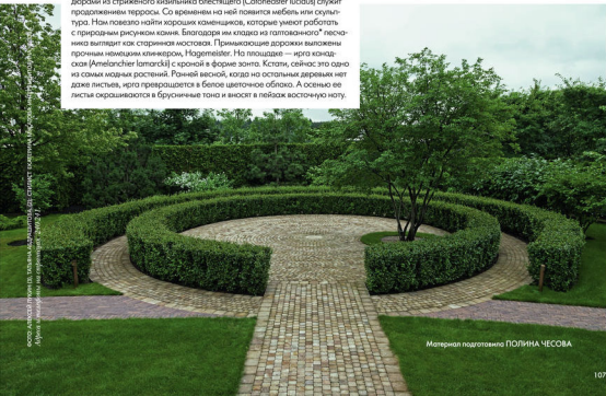
ДИЗАЙН: МАРИЯ МАКОВИЦКАЯ. ДИД. СТАНИСЛАВ БИЛЫЙ. КОМПЬЮТЕРНОЕ МОДЕЛИРОВАНИЕ: АНДРЕЙ ПИЩАКОВ. СТИЛИНГ: АНДРЕЙ ПИЩАКОВ. СТИЛИНГ: АНДРЕЙ ПИЩАКОВ. СТИЛИНГ: АНДРЕЙ ПИЩАКОВ.

План-ровка сада непосредственно связана с домом. Эта площадка с бордюрами из стриженного кизильника блестящего ( Cotoneaster lucidus ) служит продолжением террасы. Со временем на ней появится мебель или скульптура. Нам повезло найти хороших каменщиков, которые умеют работать с природным рисунком камня. Благодаря им кладка из гальванозаного* песчаника выглядит как старинная мостовая. Прилегающие дорожки выложены прочным немецким клинкером, Hagemeister. На площадке — игра канадская ( Amelanchier lamarckii ) с кроной в форме зонта. Кстати, сейчас это одно из самых модных растений. Ранней весной, когда на остальных деревьях нет даже листьев, игра превращается в белое цветочное облако. А осенью ее листья окрашиваются в брусничные тона и вносят в пейзаж восточную ноту.